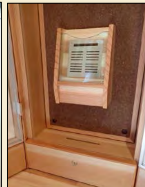
デザイン: 萩原製作所 アロマオイルプロデュース: パレアンヌ