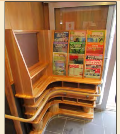
プロデュース & デザイン: はしごと 樹皮ボード提供: (株)フォレスト白神コーポレーション